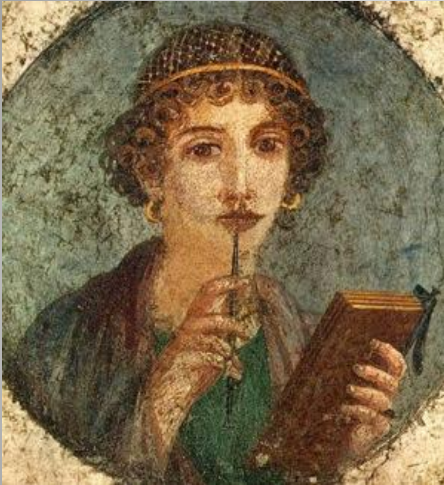
«Η στοχάστρια» Φρέσκο στην Πομπηία