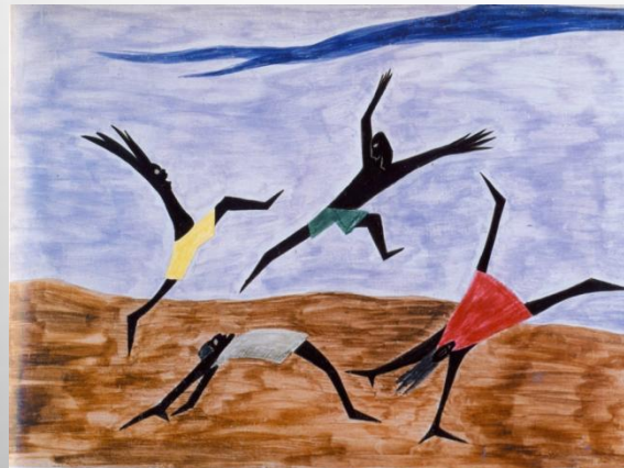
"The life of Harriet Tubman", Jacob Lawrence

Η στάση των εκπαιδευτικών για την αξιοποίηση της αισθητικής εμπειρίας στην εκπαιδευτική διαδικασία, μεταστράφηκε στο θετικότερο μετά την παρέμβαση, καθώς 16 άτομα είχαν πολύ θετική άποψη, έναντι 4 ατόμων πριν από την παρέμβαση, ενώ κανένας επιφυλακτική ή ουδέτερη στάση, σε αντίθεση με 3 άτομα πριν από την παρέμβαση.